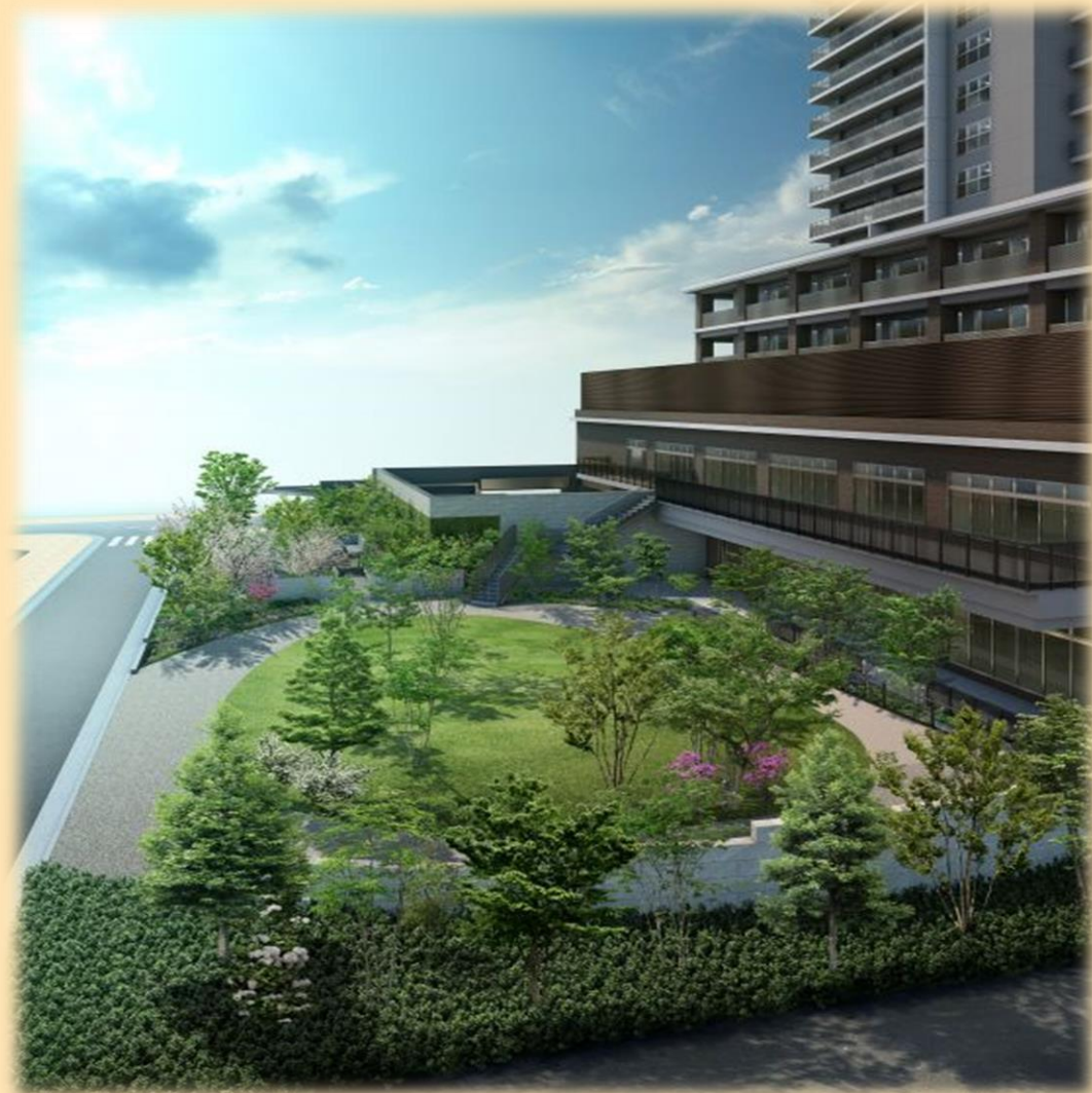
庭園のイメージ図